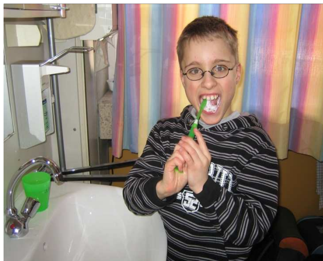
Nach dem Essen werden die Zähne geputzt. Hierbei lernen die Kinder, Körperhygiene als einen wichtigen Teil in den Tagesablauf zu integrieren.

Um ihre Selbständigkeit zu fördern, die Zusammenarbeit der Kinder untereinander zu stärken und lebenspraktische Fähigkeiten zu vermitteln, werden den Kindern verschiedene Dienste zugeteilt, wie z. B. Tisch decken und abräumen.