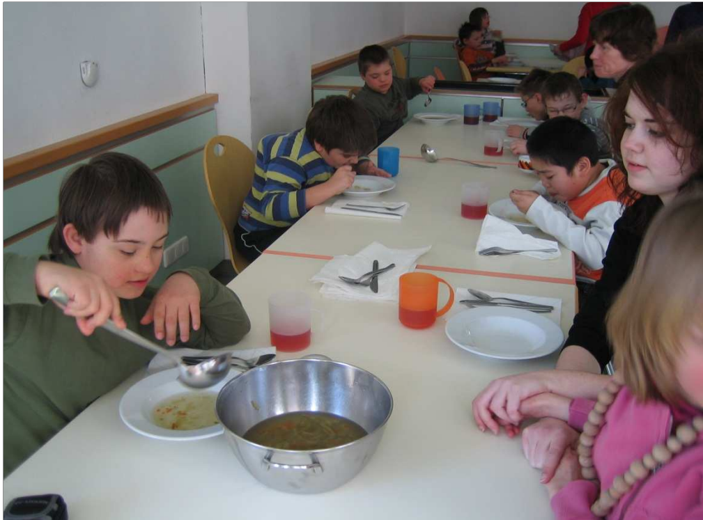
Gemeinsames Essen im Speisesaal. Uns schmeckt's!

Nach dem lernreichen Vormittag stärken sich die Kinder bei einem gesunden, abwechslungsreichen Mittagessen, das aus Suppe, Hauptspeise und Nachspeise in Form von Obst oder Joghurt besteht, dazu gibt es wärmenden Tee.